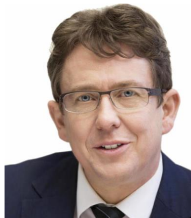
Albert Rösti Nationalrat BE / Parteipräsident SVP Schweiz