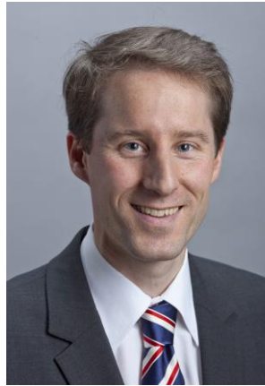
Thomas Aeschi Nationalrat ZG / Fraktionschef SVP Schweiz