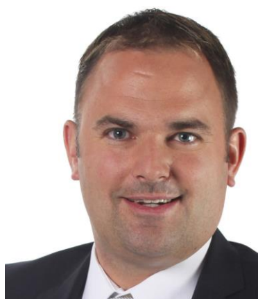
Marcel Dettling Nationalrat / Parteileitung SVP Schweiz